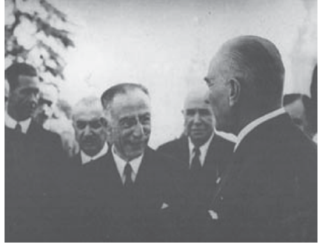
1935 yılında Dolmabahçe sarayı önünde Saffet Arıkan Atatürk'le konuşuyor.

Yeni yılınızı içten dileklerimizle kutluyoruz. Gelecek sayıda görüşmek dileğiyle.