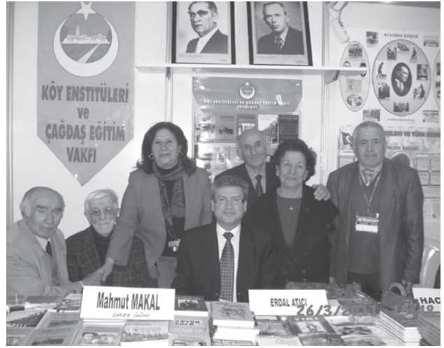
Ankara Kitap Fuarı Köy Enstitüleri ve Çağdaş Eğitim Vakfı kitap sergi yerimiz.

"17 Nisan'ı Anmak" Cumhuriyet 25 Nisan 1986